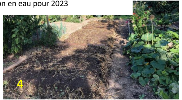
Photo 1 : l'état initial : on récupère un fermentat noir, tassé, sans air, de transformation anaérobie. Photo 2 : le lit de paille – Photo 3 : paille + compost – Photo 4 : Etat final de la parcelle après enfouissage et semis de moutarde comme engrais vert, qui va piéger les éléments fertilisants pour les restituer à la culture suivante.